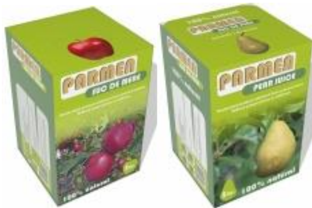
Figurile P1. Cutii sucuri de fructe Parmen