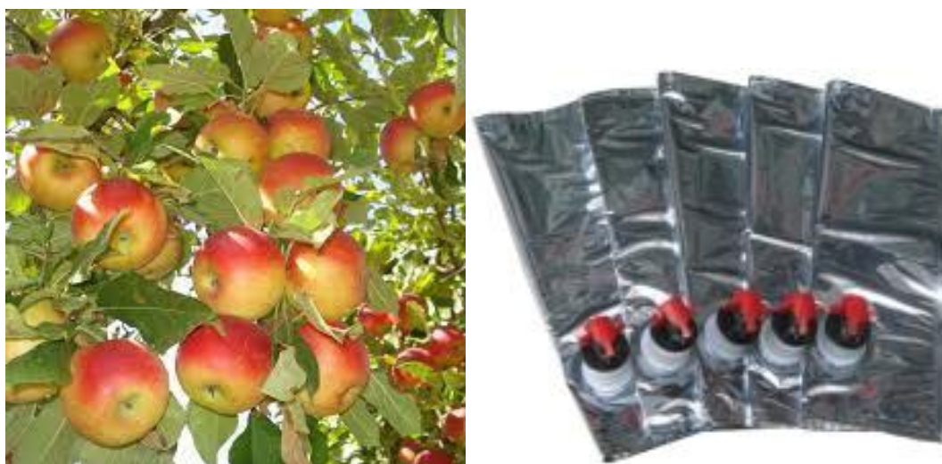
Figurile 2. Mere pentru suc de mere Parmen și ambalaje sucuri de fructe Parmen